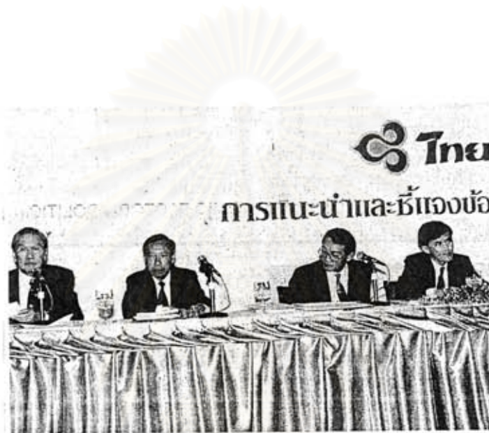
บริษัท การบินไทย จำกัด จัดงานแนะนำและชี้แจงรายละเอียดการจองซื้อหุ้นสามัญ เพิ่มทุนจำนวน 95 ล้านหุ้นของบริษัทฯ ขึ้นที่โรงแรมรอยัลลอร์ด ออคิด เซอราตัน นับ เป็นงานโรดโชว์เพื่อบุคคลทั่วไปและนักลงทุนซึ่งจัดเป็นครั้งแรกในจำนวนที่จะจัด ทั้งหมด 4 ครั้งตามจังหวัดสำคัญๆ ทั่วประเทศ

Tel: (66 2) 273 8800 Fax: (66 2) 273 8881