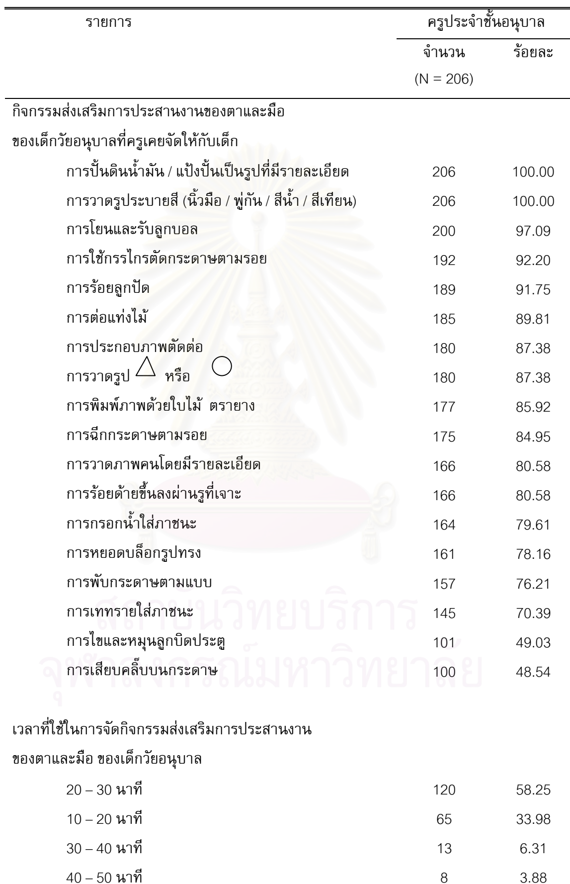
ตารางที่ 8 จำนวนและค่าร้อยละของครูประจำชั้นอนุบาล จำแนกตามข้อมูล ด้านการจัด กิจกรรมการเรียนรู้การสอน (ต่อ)